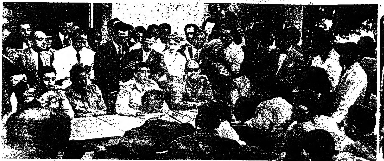
في مؤتمر صحفي عام ١٩٦٢ .. يبدو جمال عبد الناصر وجانبه، عبدالكريم عامر ومحمد نجيب ومصالح سالم وزكريا يحيى الذين

□ يعني لا يريد ان تثبت واحد وكن كما يقولون بالعربي السراج في الله .. في عدالة سلمية يتغلي كل واحد يجي دوره ويشتر بقميصه السلمة ووشية العلامات الاخوية التي يجب ان تسود بين الدول العربية .. ولو ان هذا الشور كان موجودا لما حل هذا التسره الذي حل ببنان .. وان شاء الله تكون هذه العملات للجميع . ● هل ما زلت عند موقفك من بيان الحكومة ؟ □ هناك بعض الاشياء في البيان يمكن ان تكون وريث من سوء تفهم وليس سوء قصد .